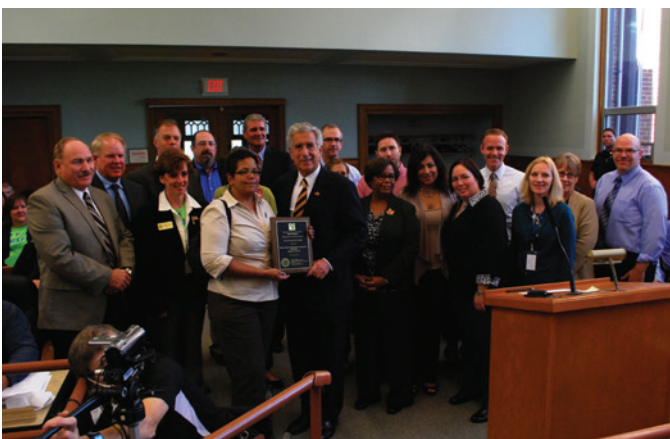
Members of the Kane County Planning Co-op, along with members of the Kane County Board, display the “Best Practice Award” from the American Planning Association.

La Cooperativa de Planificación del Condado de Kane está dotada de personal gracias a los esfuerzos conjuntos del Departamento de Desarrollo, el Departamento de Salud y la División de Transportes del Condado de Kane (KDOT, por su sigla en inglés) para la implementación de la visión del Plan 2040 con nuestras municipalidades y otros asociados de planificación. La Cooperativa de Planificación del Condado de Kane estableció un sistema de planificación financieramente responsable, eficiente y eficaz para la salud, el transporte y el uso de tierras. En 2013, la Cooperativa de Planificación del Condado de Kane logró establecer contactos con otros asociados, cuando representantes realizaron presentaciones en la Conferencia Nacional de la Asociación de Planificación Estadounidense en Chicago en abril; un webinar de la Asociación Estadounidense de Salud Pública en mayo; la Conferencia de Cambio de 2013 en Rosemont, Il. en junio; la Conferencia Anual de Planificación Regional de Capitales en Madison, Wis. en octubre; y la Reunión y Exposición de la Asociación Estadounidense de Salud Pública en Boston, Ma., en noviembre.